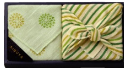
↑ AINOYA「タオルハンカチ・金平糖セット」