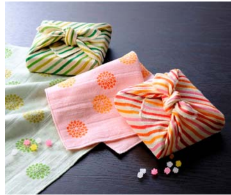
←AINOYA「バス・フェイスタオル・タオルハンカチセット」※こちらのセットに金平糖は含まれません。