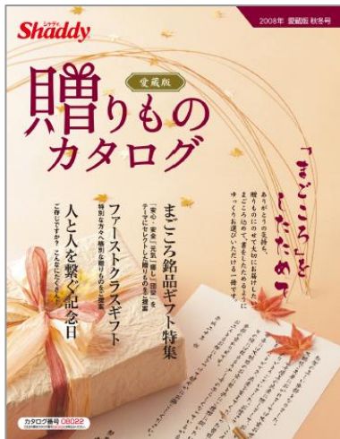
贈りものカタログ(愛蔵版)